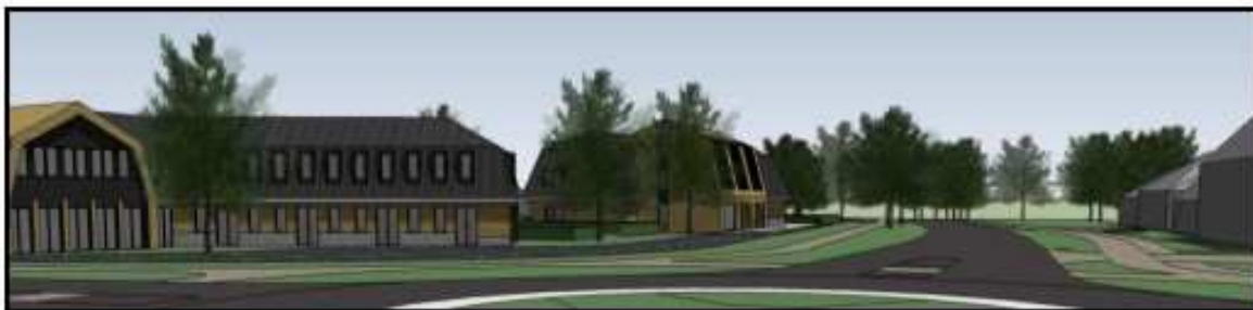
Impressie ensemble vanaf de rotonde Veldweg – Oirschotseweg.